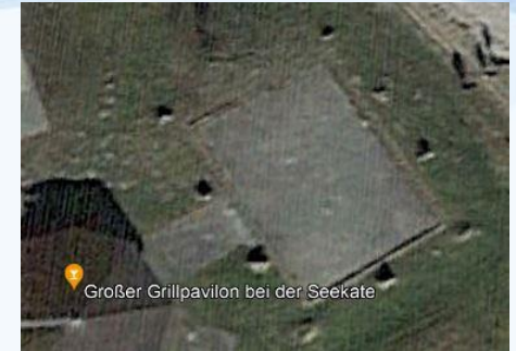
Großer Grillpavilon bei der Seekate

Zählt die Steine! _____ (auf dem Foto kann man nicht alle Steine sehen)